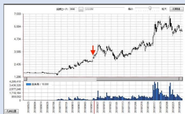
2018年9月22日秋号「四季報成長株研究会」で取り上げた銘柄の一例