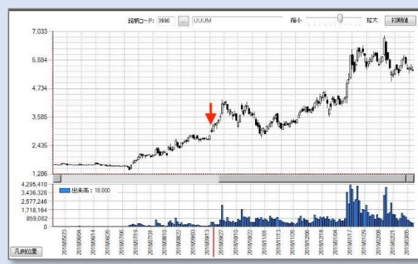
2018年9月22日秋号「四季報成長株研究会」で取り上げた銘柄の一例